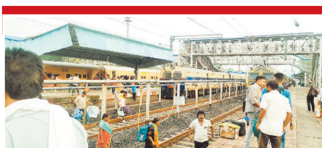
यात्रियों और स्थानीय संगठनों ने डीआरएम कार्यालय से आग्रह किया है कि इस प्रस्ताव को 6 माह की ट्रायल अवधि के लिए शुरू किया जाए। ट्रायल पूर्ण होने के

एमसीबी जिले के हजारों रेल यात्रियों की लंबे समय से उठती आवाज शहडोल-नागपुर ट्रेन को चिरमिरी तक विस्तारित किए जाने की एक बार फिर जोर पकड़ रही है। यह मांग केवल एक सामान्य अपेक्षा नहीं, बल्कि शिक्षा, स्वास्थ्य, व्यापार, रोजगार और पर्यटन जैसे महत्वपूर्ण क्षेत्रों से जुड़े व्यापक जनहित का मुद्दा है। क्षेत्र के विभिन्न संगठनों, जनप्रतिनिधियों और आम यात्रियों ने रेलवे प्रशासन से इस प्रस्ताव पर गंभीरता से विचार करने की अपील की है। इस प्रस्ताव की सबसे बड़ी विशेषता यह है कि