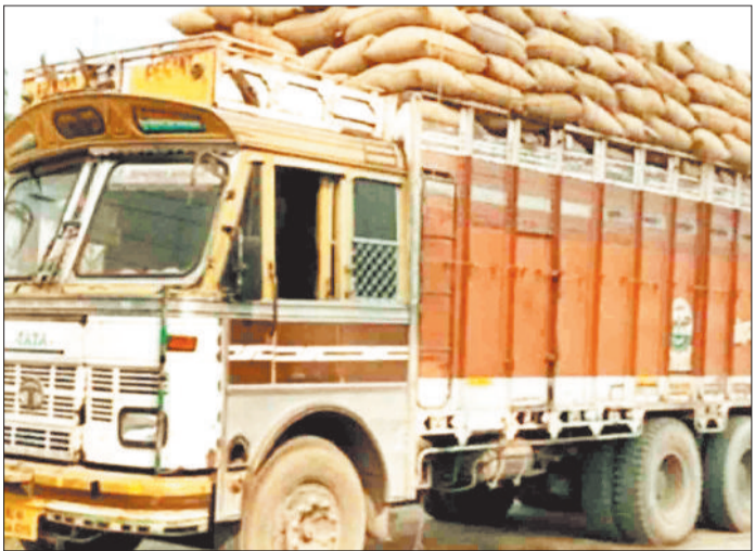
हरिभूमि न्यूज ▶▶ प्रतापपुर

जिले में धान खरीदी प्रक्रिया शुरू होने के बाद से एक बार फिर प्रतापपुर सहित सीमावर्ती क्षेत्रों में कोचिया एवं राइस मिलर्स की संदिग्ध गतिविधियां शुरू हो गई है। आलम यह है कि कई जगह भारी मात्रा में धान का भंडारण करने की संभावना है। ऐसे में अब क्षेत्र के लोगों ने भी अवैध धान भंडारण एवं कोचियों के विरुद्ध कार्रवाई किए जाने की मांग की है जिससे किसान अपनी उपज को आसानी से धान उत्पादन केंद्र में बेच सकेंगे।