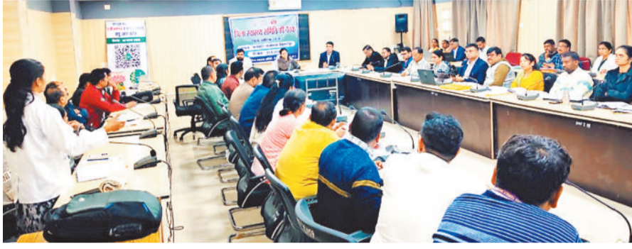
बैठक लेती कलेक्टर एवं उपस्थित अधिकारी।

कलेक्टर ने विशेष रूप से मातृ एवं शिशु मृत्यु दर के प्रति चिंता व्यक्त की और सभी ब्लॉकों को ठोस कार्ययोजना बनाकर तत्काल जिले को प्रेषित करने के निर्देश दिए। उन्होंने कहा कि मातृ एवं शिशु मृत्यु दर को कम करने के लिए समन्वित कार्रवाई, सतर्कता और समय पर उपचार बेहद आवश्यक है। एचक्यूआरपी (जोखिम वाली गर्भवती महिलाओं) को चिन्हित कर उनका समय पर रेफरल जिला अस्पताल तक सुनिश्चित किया जाए। गर्भवती महिलाओं की पहली और चौथी तिमाही में अनिवार्य स्वास्थ्य जांच कराई जाए। प्रधानमंत्री सुरक्षित मातृत्व दिवस