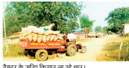
ट्रैक्टर के जरिए किसान ला रहे धान।